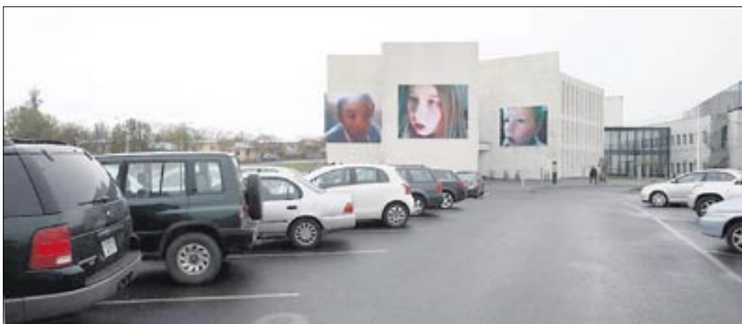
The Nordic Housen näyttelyssä on mukana myös suomalaisia valokuvaajia. Renja Leinon valtavankokoiset kasvokuvat lapsista ovat levittäytyneet läheisen yliopiston ulkoseinille. Leino on kuvannut tietokonepeliin uponneita lapsia.